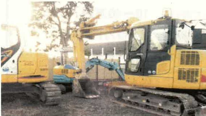
大型重機で小型重機を囲み、上方を塞ぐ